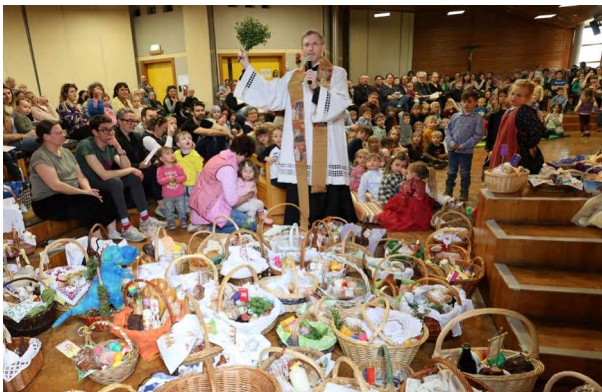
Segnung der österlichen Speisen bei der Kinder- auferstehungsfeier 2024 im Pfarrzentrum.

Auch Sie können Ihre Speisenkörbe in allen Ostergottesdiensten unserer Pfarreiengemeinschaft segnen lassen.