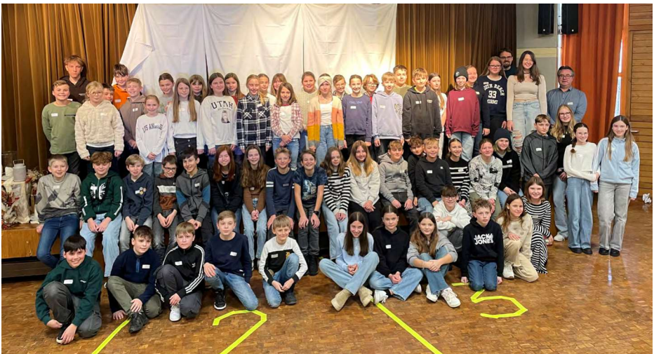
Jugendliche freuen sich auf die Firmung